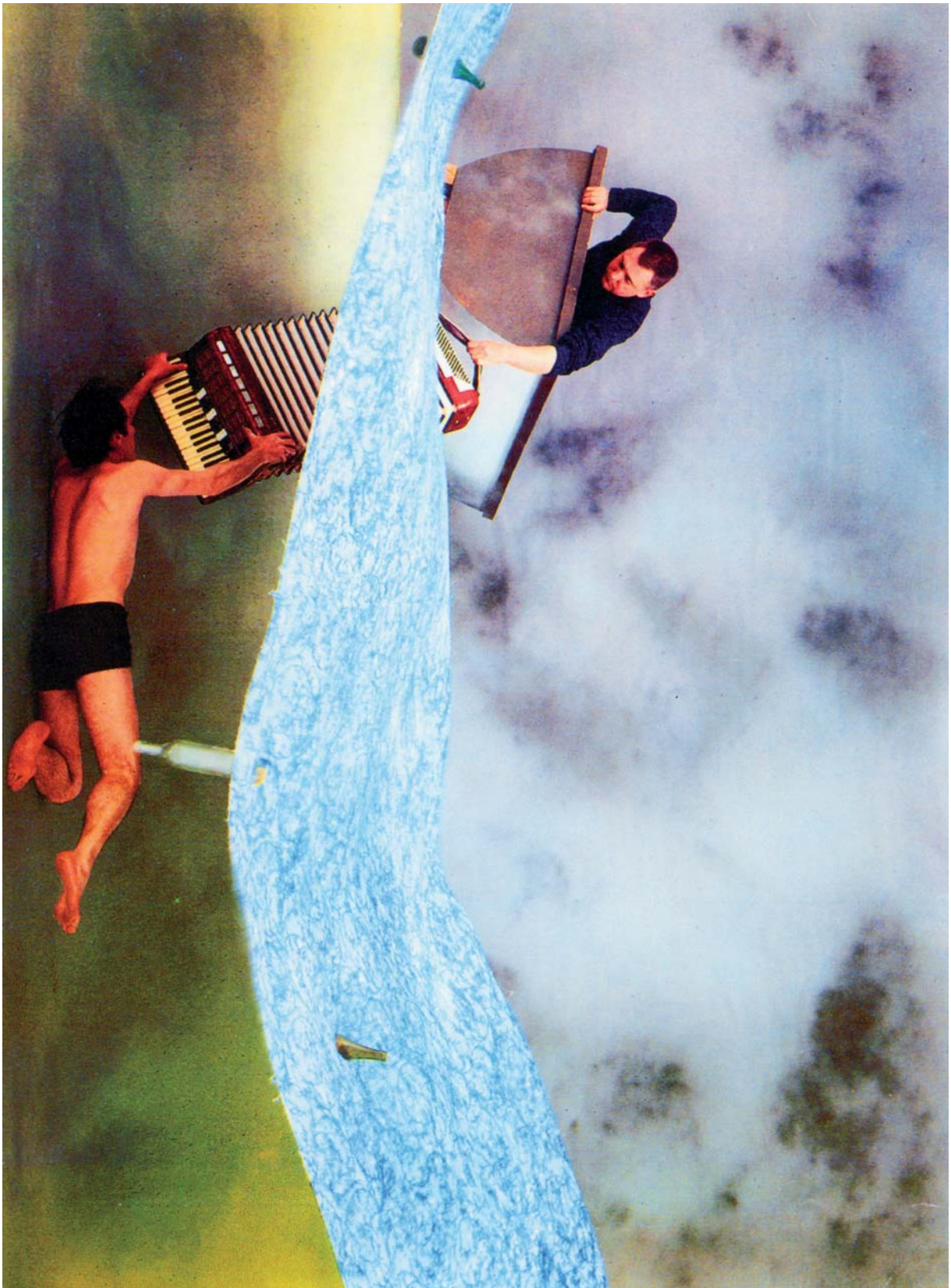
Document 3 Boyd WEBB, Lung (poumon) , 1983, photographie couleur, 127 x 153 cm