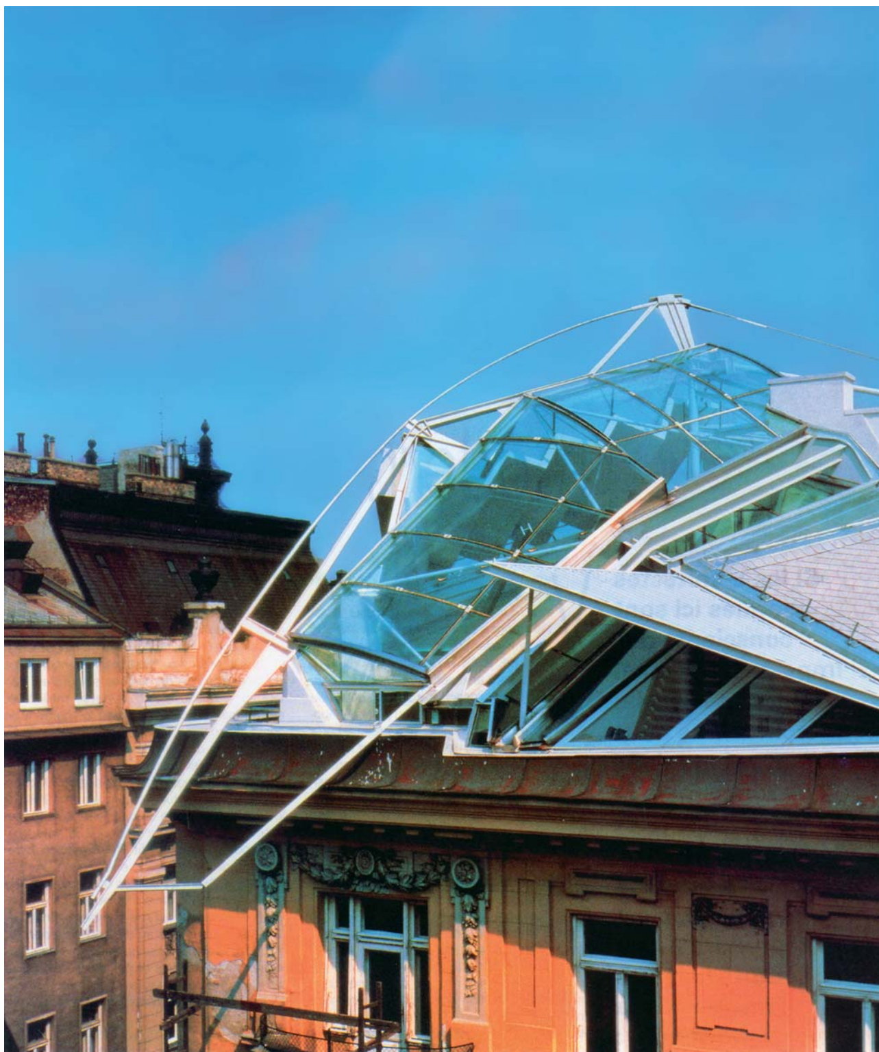
Document 2 COOP HIMMELB(L)AU, Remodelage d'un toit pour un cabinet d'avocats , 1984-89, Vienne, Autriche